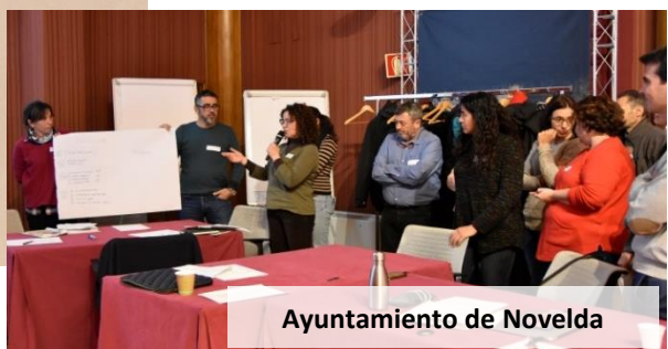
Ayuntamiento de Novelda