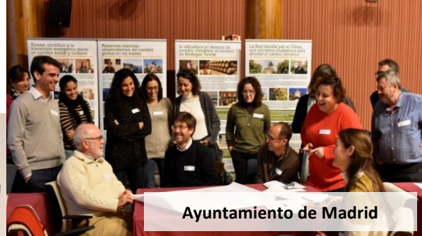
Ayuntamiento de Madrid