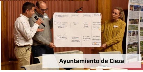
Ayuntamiento de Cieza