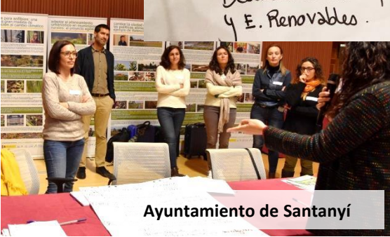
Ayuntamiento de Santanyí