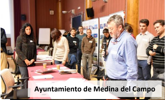
Ayuntamiento de Medina del Campo